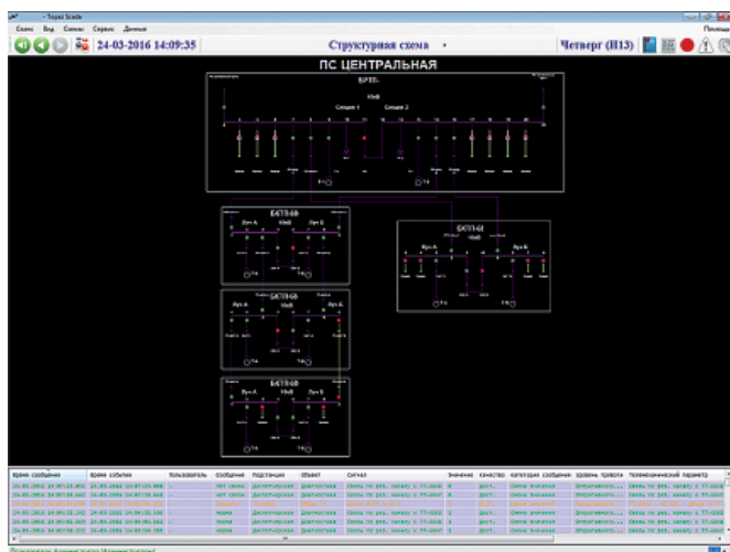
Рис. 2. АРМ TOPAZ SCADA с отображением участка «умной» сети 10 кВ

Для реализации указанной задачи могут использоваться следующие группы сигналов: сигнал срабатывания устройства протекания тока короткого замыкания (УТКЗ) («сухой» контакт), сигнал общего срабатывания устройства РЗА («сухой» контакт), сигналы срабатывания конкретных функций РЗА (цифровой сигнал — при возможности снятия информации). Данные о срабатывании указанных устройств отображаются на АРМ диспетчера рассматриваемого района (рисунок 2). При этом, при наличии нетелемеханизированных объектов, диспетчер на основании отображаемых данных не может однозначно понять, на каком присоединении произошло повреждение, однако он может определить группу смежных объектов, в сторону которой необходимо направлять бригаду ОВБ для устранения неисправности и перевода режима питания. Чем выше степень оснащения объектов электросетевого комплекса локальными системами ССПИ, тем выше точность определения поврежденного участка и тем меньше время локализации и ликвидации повреждения.