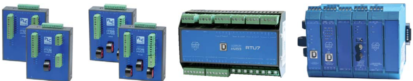
Рис. 1. Многофункциональные микропроцессорные устройства (контроллеры ячеек) ТОРАЗ серии HVD и ТМ