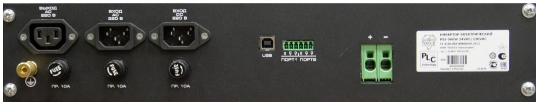
Рисунок 2. Внешний вид задней панели устройства