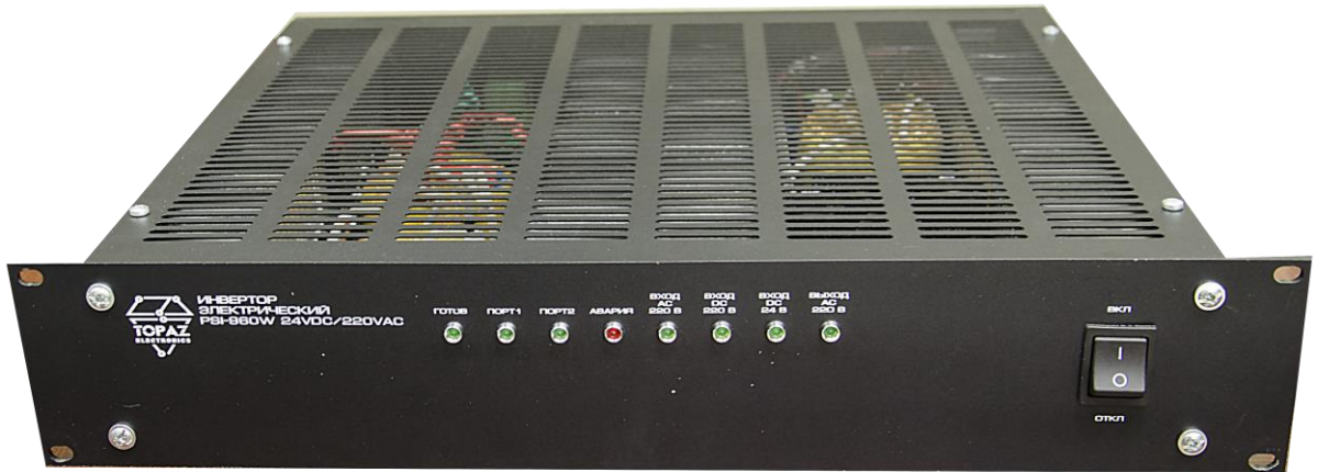
Рисунок 1. Внешний вид устройства