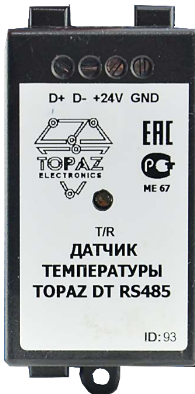
Рисунок А.1 – Внешний вид устройства